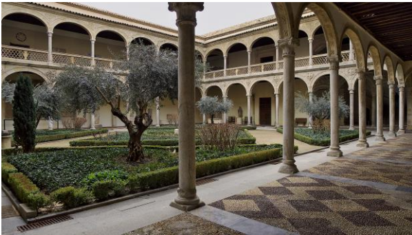
Hospital de la Santa Creu (1401-1902)

Hospital de enfermedades infecciosas y psiquiátrico Actualmente Biblioteca de Cataluña