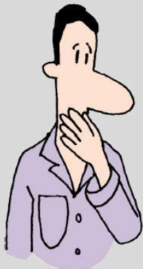
Aguantar la respiració