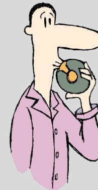
Agafar aire enèrgicament