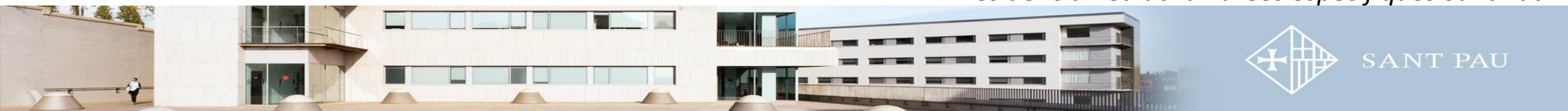
Residència Pediatria i àrees específiques Sant Pau