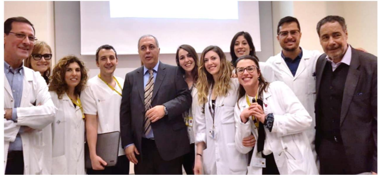
Residencia Cirugía Cardiovascular en Sant Pau