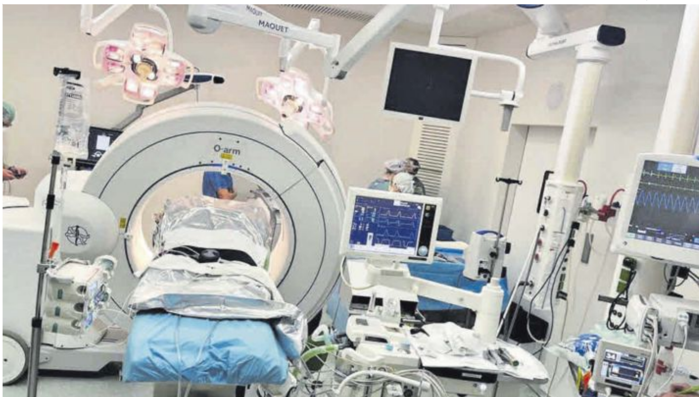
Quiròfan de l'Hospital de Sant Pau on es fan les intervencions per curar la depressió, entre altres operacions