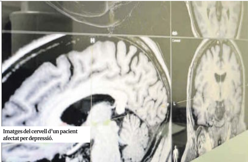
Imatges del cervell d'un pacient afectat per depressió.

Els bons resultats obtinguts (sempre a llarg termini, de vegades fins a vuit o nou anys després) porten Aibar a pensar que, a poc a poc, augmentaran els pacients que es puguin operar de depressió (tot i que continuaran sent un percentatge mínim). «Aquestes persones a qui no pot ajudar el seu metge de capçalera ni el seu psiquiatre podrien ser derivades a un