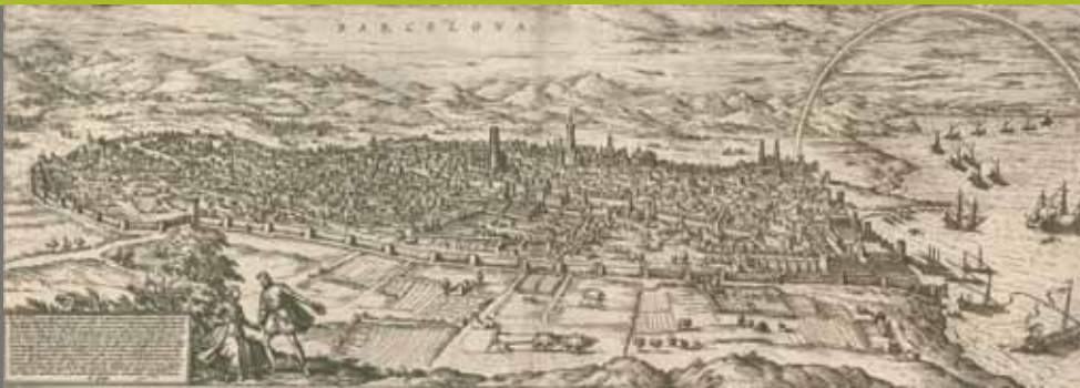
Gravat de Barcelona (1572)

Des del moment de la seva creació el 1401, l'Hospital de la Santa Creu ha estat un dels hospitals més grans d'Europa. Per posar en marxa un projecte de tanta envergadura, els poders religiosos i civils del moment van arribar a una entesa.