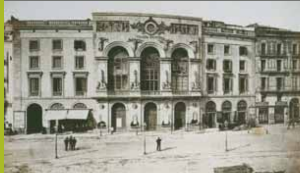
Teatre Principal (1874)

Al llarg dels anys l'Hospital s'ha enfrontat a nombroses dificultats econòmiques, a grans problemes de salut com les epidèmies i a importants pressions polítiques. L'any 1558, la pesta va afectar gran part de la ciutat de Barcelona. L'Hospital va quedar en mans d'un sol prior, que el va haver d'administrar amb l'ajuda de la seva família. El 1651, una altra pesta va deixar l'Hospital sense metges i el Consell de Cent va haver de reclutar els facultatius anant-los a buscar a casa, obligant-los sota amenaça de mort.