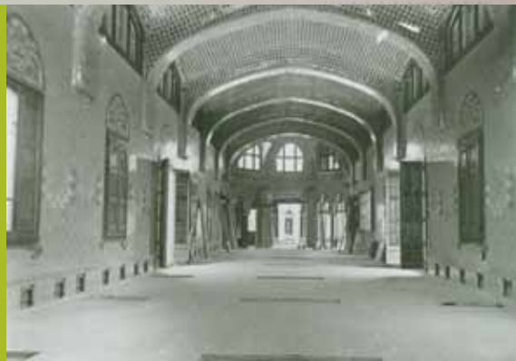
Sala de malalts a l'hospital medieval