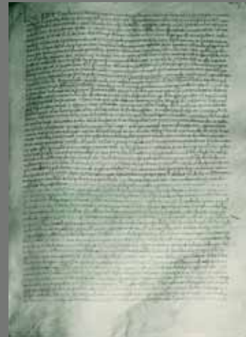
Llegat de Joan de Serrallonga

El 1831, el baró de Castellet va deixar en testament el seu palau del carrer Montcada de Barcelona, actual seu del Museu Picasso.