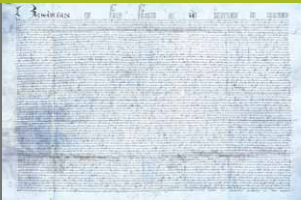
Butlla del papa Benet XIII que al 1401 autoritza la fundació de l'Hospital de la Santa Creu

El Consell de Cent i l'Església es van fer càrrec de la construcció i manteniment, i el Rei hi va contribuir econòmicament i va atorgar privilegis que revertien a l'Hospital. Poc després, el papa Benet XIII va emetre una butlla que beneïa la construcció del nou hospital i donava 10.000 ducats d'or per a les obres.