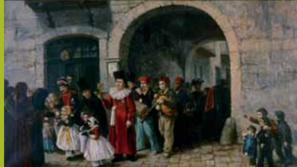
Collecta per a l'Hospital de la Santa Creu

Al segle XVI, Felip II va atorgar el privilegi de gestionar les actuacions dels comedians a la ciutat, amb el benefici que això comportava. Una donació a l'Hospital va permetre construir el Teatre de la Santa Creu al final de la Rambla, que es va ampliar i reconstruir com a Teatre Principal. Els beneficis de les funcions que hi tenien lloc revertien a l'Hospital. Una situació que va durar fins que la fi del monopoli de les representacions va traspasar el protagonisme al Liceu i a altres teatres més moderns.