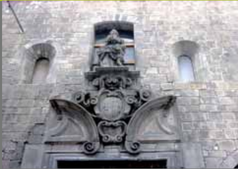
Escut a la porta d'entrada de l'Hospital de la Santa Creu.

El caràcter benèfic i públic de l'Hospital ha ajudat a establir una relació molt directa amb els ciutadans. Era l'hospital de la gent, on tothom era rebut i atès. Aquesta relació explica que, des que es van començar les obres, les ajudes de grans benefactors i de ciutadans han fet possible el manteniment de l'Hospital durant sis segles.