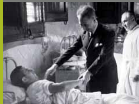
Lluís Companys, en una visita a l'Hospital de la Santa Creu i Sant Pau

Aquest ha estat l'únic període durant el qual l'Hospital no ha estat dirigit per la Molt Il·lustre Administració, una situació excepcional que va durar fins que es va acabar el conflicte bèl·lic l'any 1939.