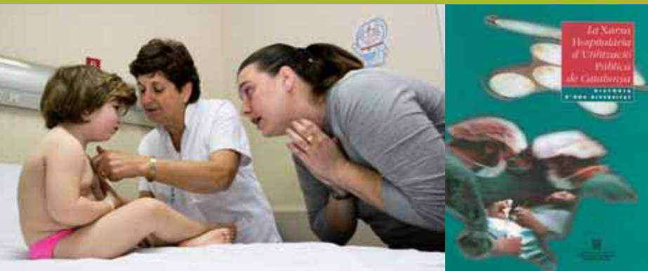
L'Hospital està integrat a la Xarxa Hospitalària d'Utilització Pública de Catalunya

Amb el Decret de Nova Planta (1716) van fer desaparèixer moltes institucions catalanes, i el Consell de Cent va ser substituït pel model basat en l'ajuntament. A partir d'aquest moment els dos prohoms que representaven la ciutat van ser substituïts per dos regidors.