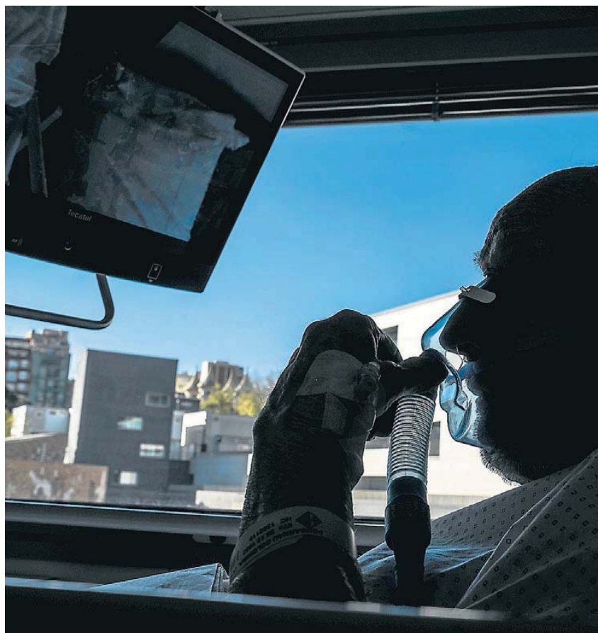
Un pacient ingressat a la unitat covid de l'Hospital de Sant Pau de Barcelona.

La imatge de l'"altiplà inestable" que assenyalen l'Hospital del Mar i el Germans Trias i Pujol defineix l'evolució de les hospitalitzacions en pràcticament tots els centres de