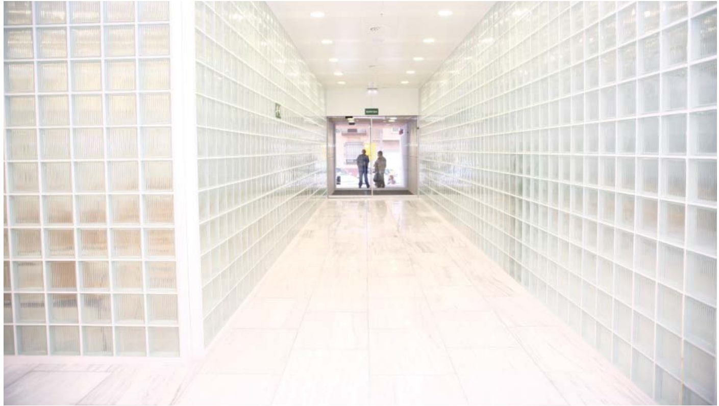
Passadís d'entrada al Servei d'Urgències Generals i de Pediatria