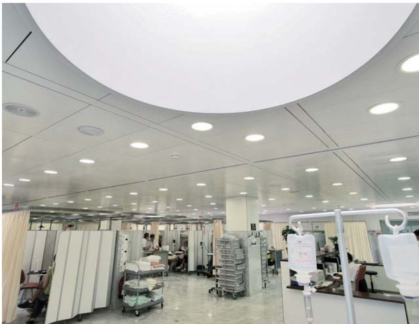
Hospital de Dia d'Hematologia i Oncologia