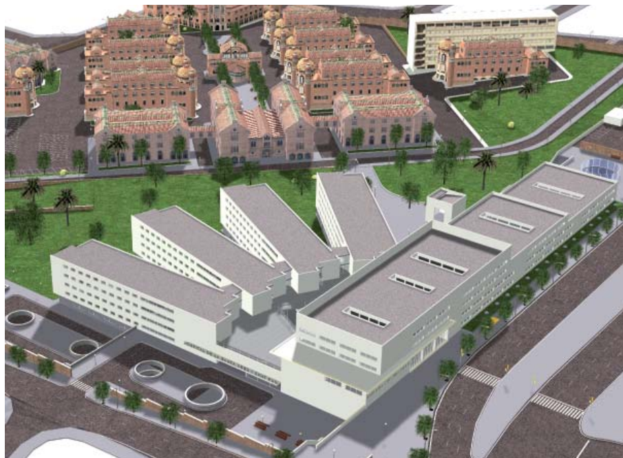
Model 3D del Nou Hospital i del Recinte Històric de Sant Pau

L'Hospital modernista, edificat a principis del segle passat, va esdevenir poc funcional per a la pràctica de la medicina moderna.